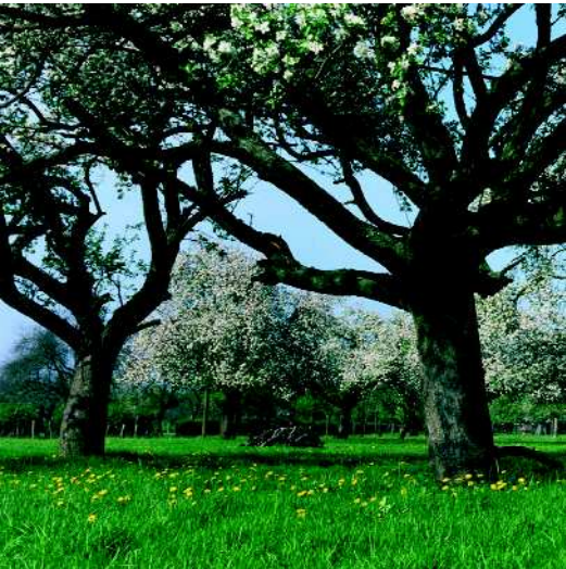
Streuobstwiese am Niederrhein