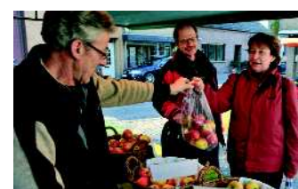
Verkauf von niederrheinischen Kartoffeln und Äpfeln

über Fleisch, Wild und Geflügel bis zu Gemüse, Obst, Säften, Kräutern, Blumen und Pflanzen – aber alles zu seiner Zeit, d. h. dann, wenn die Natur es hergibt. Gäste kommen von weiter nach Winnekendonk, um im Sommer auf dem Marktplatz unter einem grünen Blätterdach z. B. eine der 30 Kuchenspezialitäten zu genießen. Das Landfrauencafé in Loikum zieht sogar ganzjährig Kuchenliebhaber an.