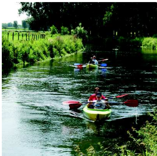
Paddeln auf Niers und Lippe