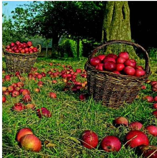
Die Rote Sternrenette zur Erntezeit