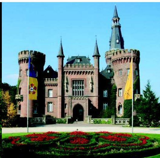
Schloss Moyland, Bedburg-Hau